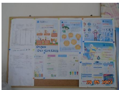
รูปที่ 2-3 บอร์ดประชาสัมพันธ์ของโครงการ