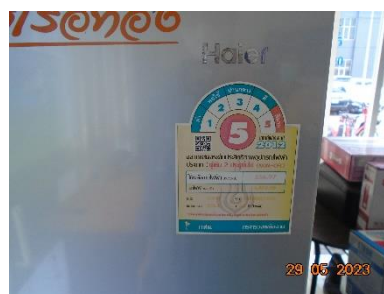
รูปที่ 2-7 เครื่องใช้ไฟฟ้าเบอร์ 5