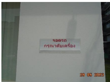
รูปที่ 2-1 ป้ายห้ามติดเครื่องยนต์