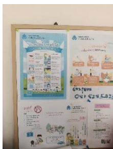
รูปที่ 2-5 ป้ายรณรงค์ประหยัดน้ำ-ไฟ