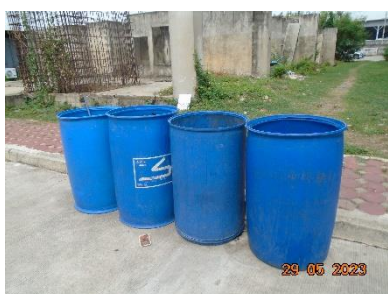
รูปที่ 2-6 ถังขยะรวมของโครงการ