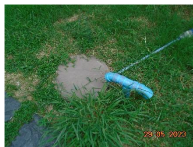
รูปที่ 2-4 ระบบบำบัดน้ำเสียโครงการ