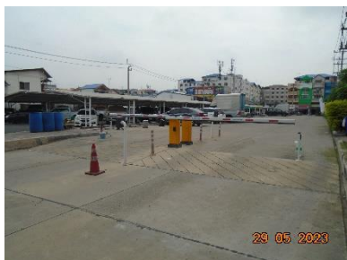
รูปที่ 2-12 เครื่องกันรถเข้า-ออก โครงการ