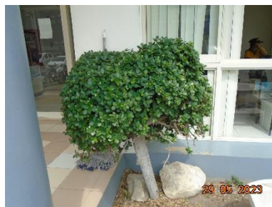
รูปที่ 2-13 พื้นที่สีเขียวของโครงการ