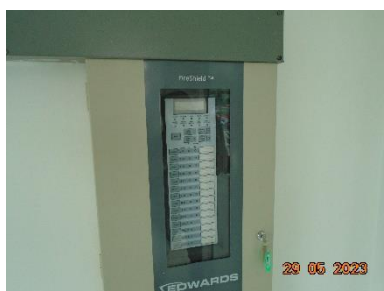
รูปที่ 2-8 อุปกรณ์ป้องกันและระงับเหตุเพลิงไหม้