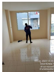
รูปที่ 2-2 แม่บ้านทำความสะอาด