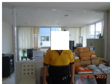
รูปที่ 2-10 เจ้าหน้าที่รักษาความปลอดภัยของโครงการ