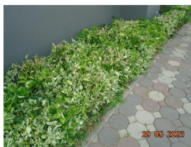
รูปที่ 2-13 (ต่อ) พื้นที่สีเขียวของโครงการ