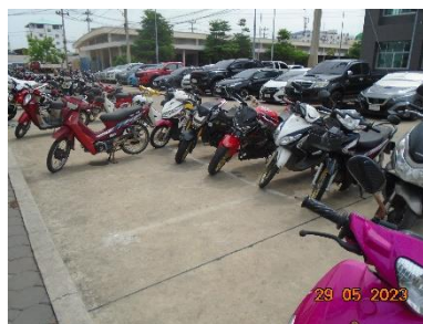
รูปที่ 2-11 พื้นที่จอดรถโครงการ